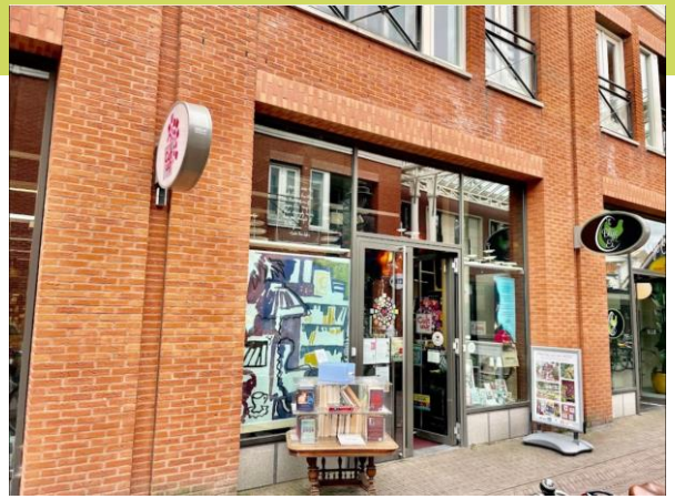
Boekhandel van der Meer De Keuvel 1, 2201 MB Noordwijk